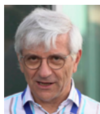
a cura di Alessandro Balsamo INRIM