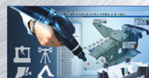
PolyWorks® Metrology Suite uno per tutti e tutti in uno! ...